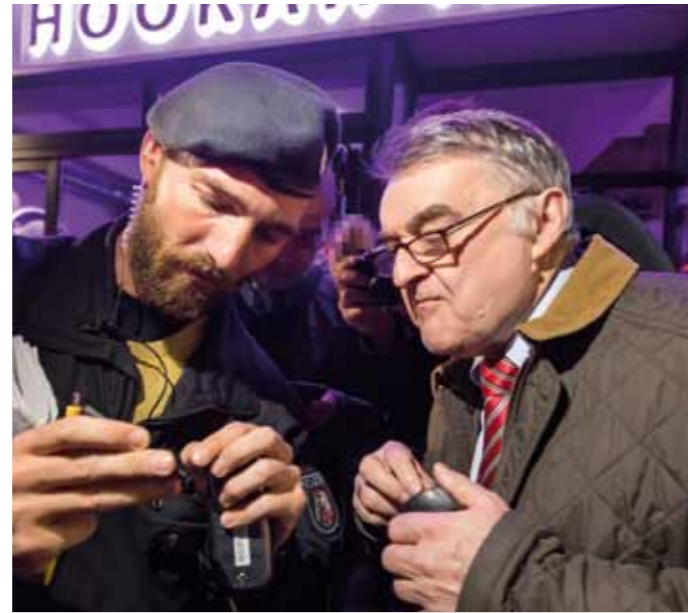
NRW-Innenminister Reul interessiert sich auch für die Details.

Ein Sondereinsatz wie in dieser Nacht ist notwendig, denn in der Vergangenheit gab es im Bereich der nördlichen Essener Innenstadt häufiger gewalttätige Auseinandersetzungen zwischen unterschiedlichen Familienclans. Die meisten beteiligten Personen gehören der Volksgruppe der Mhallamiye an. Sofern Clanmitglieder beteiligt sind, erfahren Polizeibeamte bei der Einsatzbewältigung ein ausgeprägt respektloses Verhalten, gepaart mit hoher Aggressionsbereitschaft. Häufig können Platzverweise nur mit weiteren Verstärkungskräften durchgesetzt werden, da die Betroffenen sich unbeeindruckt geben und sich bewusst den polizeilichen Anordnungen widersetzen. Derzeit sind etliche Gewerbebetriebe in der nördlichen Innenstadt Anlauf- und Rückzugsorte von Clanmitgliedern. Es handelt sich dabei im Einzelnen um Shisha-Bars, Gaststätten, Teestuben, Wettbüros oder ähnliche Geschäftsräume. Insgesamt führt die Situation dazu, dass die Bevölkerung der nördlichen Essener Innenstadt sich nicht mehr sicher fühlt. Betroffen sind die anderen Geschäftsleute und Gewerbetreibenden, aber auch die Anwohner und Besucher dieses belebten und beliebten Stadtviertels.