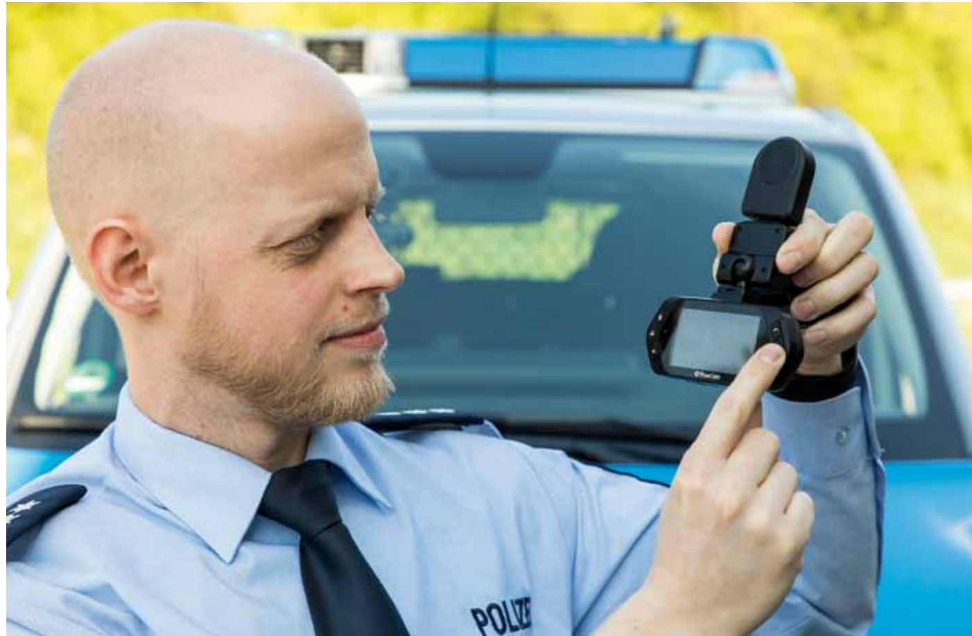
Die Dashcams sind einfach zu bedienen und helfen dabei, Rettungsgassenverweigerer zu identifizieren.