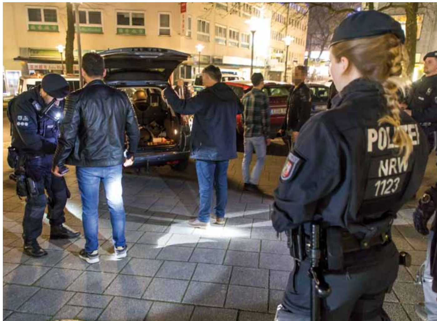
Im Rahmen der Razzia werden nicht nur Bars und Geschäfte durchsucht, sondern auch Fahrzeugkontrollen durchgeführt.