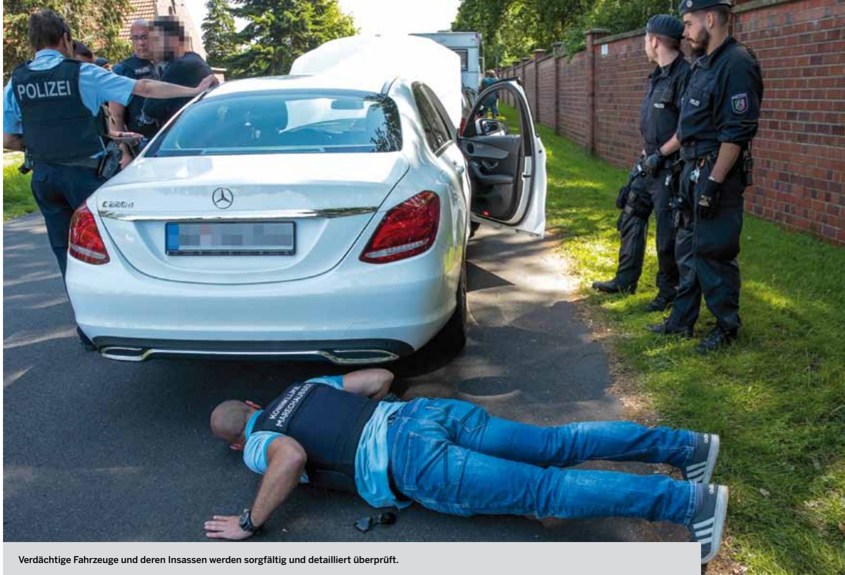
Verdächtige Fahrzeuge und deren Insassen werden sorgfältig und detailliert überprüft.

verdächtige Fahrzeuge auf der BAB 52 zur Kontrollstelle. Fahrzeuge und deren Insassen wurden dort im Anschluss durch die Beamtinnen und Beamten der Landes- und Bundespolizei kontrolliert. »Der erhöhte Fahndungsdruck ist ein wichtiger Baustein zur Verbesserung der Sicherheit in Nordrhein-Westfalen. Die Kontrollen helfen uns außerdem dabei, die Strukturen der Einbrecherbanden besser zu durchschauen«, so Minister Reul.