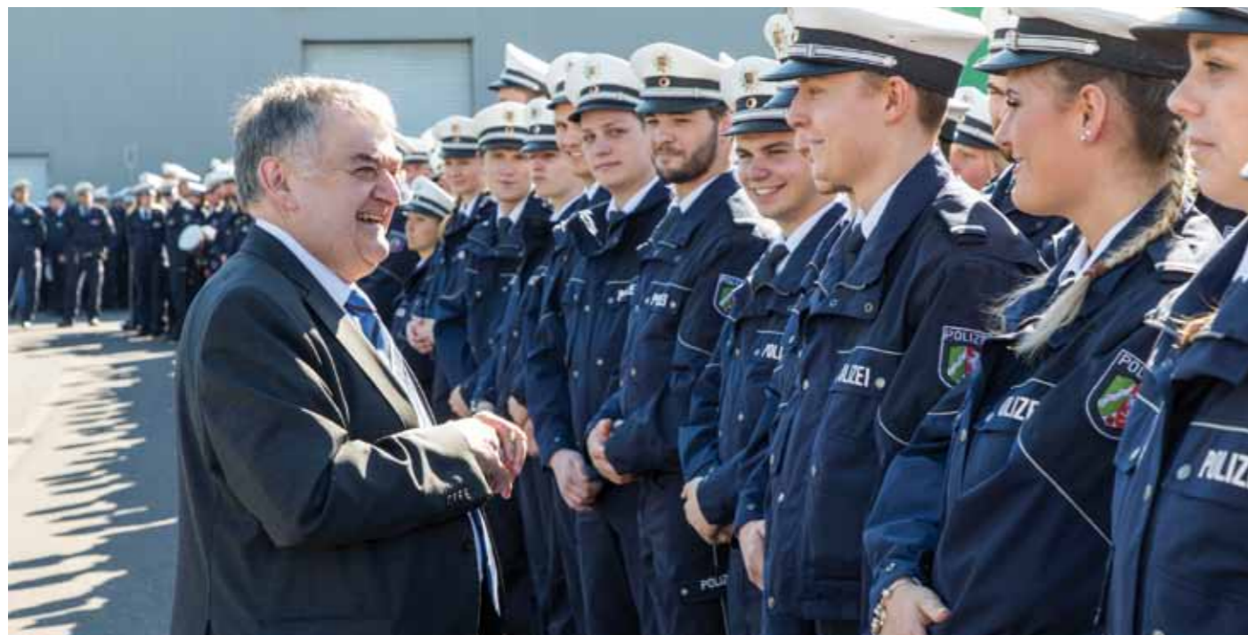
NRW-Innenminister Herbert Reul begrüßt die Kommissaranwärterinnen und -anwärter beim Aufstellen zum Einzug in die Lanxess-Arena.