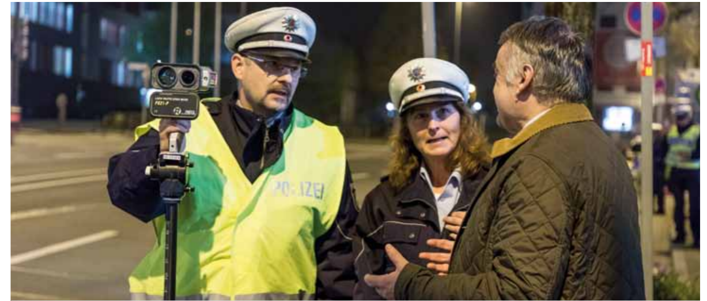
Die Geschwindigkeitsüberwachung gehört zum Maßnahmenpaket dieser Nacht.