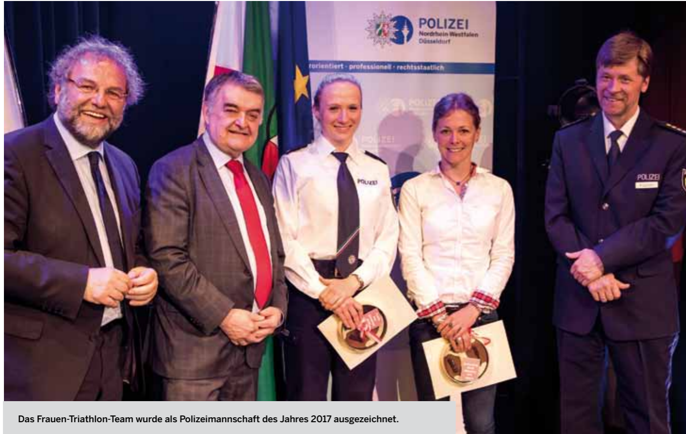
Das Frauen-Triathlon-Team wurde als Polizeimannschaft des Jahres 2017 ausgezeichnet.