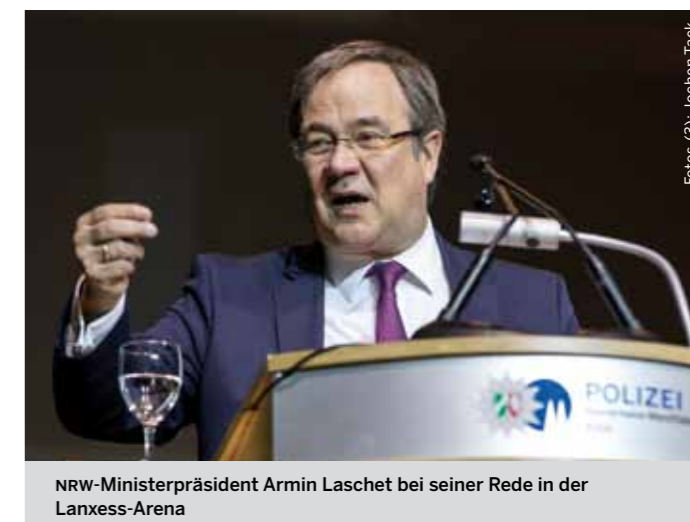
NRW-Ministerpräsident Armin Laschet bei seiner Rede in der Lanxess-Arena

abgeschafft. Laschet weist auch darauf hin, dass das Land 500 zusätzliche Polizeiverwaltungsassistenten einstelle, die sich mit dem Abarbeiten von Verwaltungsvorgängen beschäftigen und die Polizei NRW dadurch entlasten sollen. Er kündigt außerdem an, dass im September die erste von sechs geplanten Beweissicherungs- und Festnahmeeinheiten ihre Arbeit aufnehmen werde. Es soll auch wieder verdachtsunabhängige Kontrollen hinter der Grenze zu Belgien und den Niederlanden geben. Armin Laschet wünscht sich eine Polizei, in der sich auch widerspiegelt, dass inzwischen ein Viertel der Einwohner von Nordrhein-Westfalen eine Migrationsgeschichte haben. Er macht klar, welche Grundeinstellung er sich bei der Polizei wünscht: »Wichtig ist nicht, welche Religion oder welche Herkunft man hat, sondern: Kann ich mich auf dich verlassen? Da spielen Kultur, Herkunft, Religion keine Rolle. Deshalb ist es gut, dass sich auch in diesem Einstellungsjahrgang Menschen mit Migrationsgeschichte wiederfinden.«