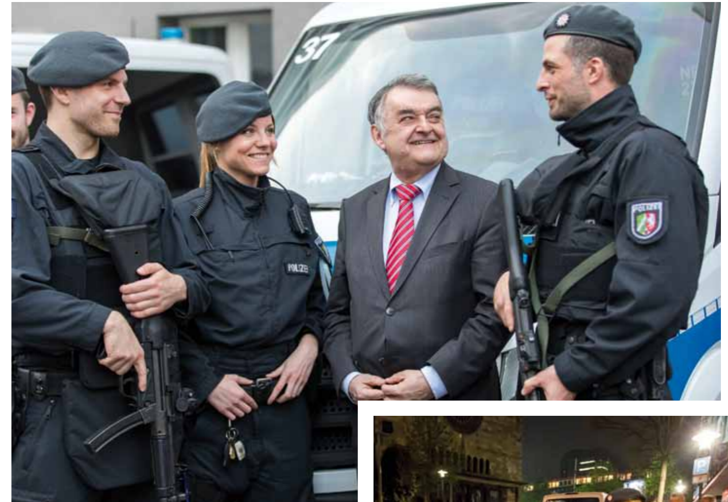
Herbert Reul erläutert die Ziele der Aktion aus Sicht der Landesregierung.