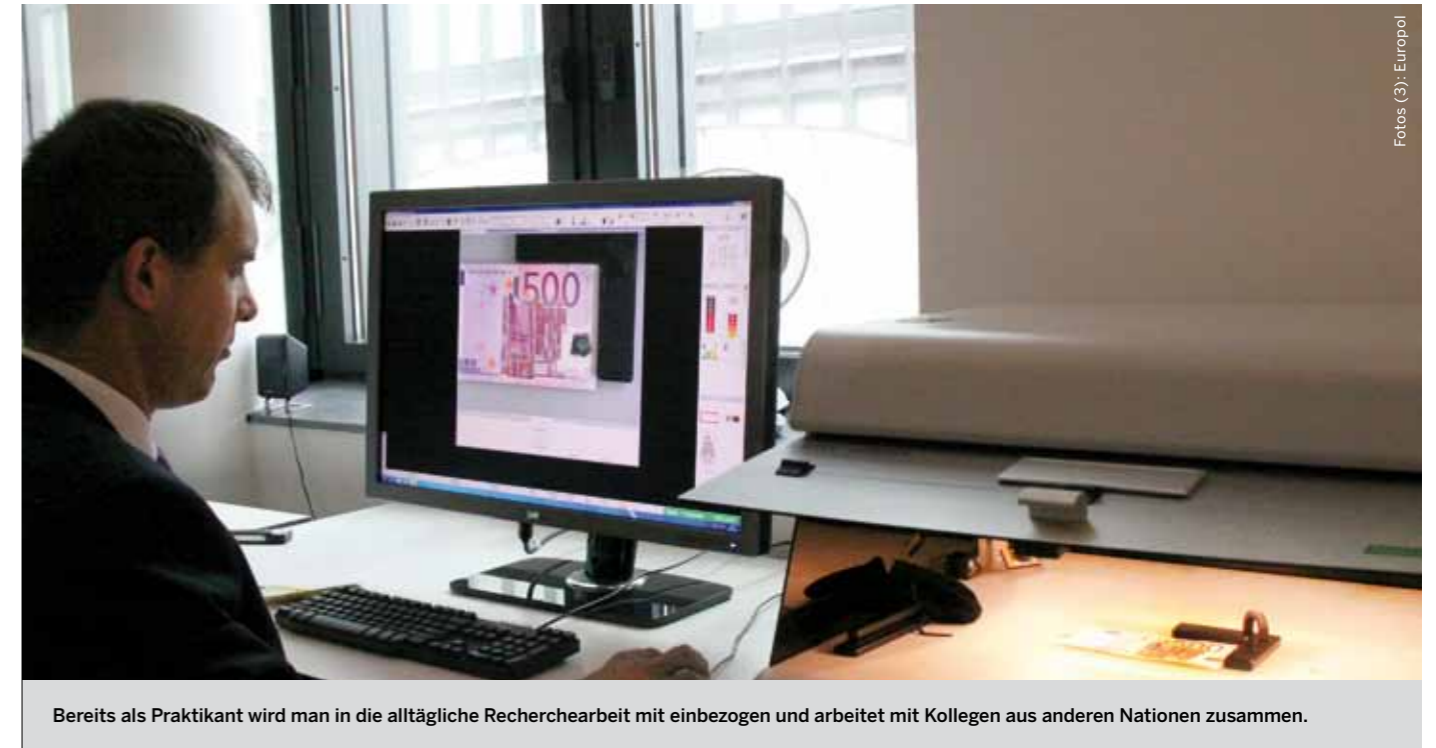
Bereits als Praktikant wird man in die alltägliche Recherchearbeit mit einbezogen und arbeitet mit Kollegen aus anderen Nationen zusammen.

Die Hospitanten werden zum Dienstantritt in Den Haag mit einem personalisierten Batch mit den erforderlichen Zugangsberechtigungen ausgestattet. Als Law-Enforcement-Mitarbeiter umfasst dies auch den Zugang zu den nochmals gesondert abgesicherten Bereichen der Operational Departments.