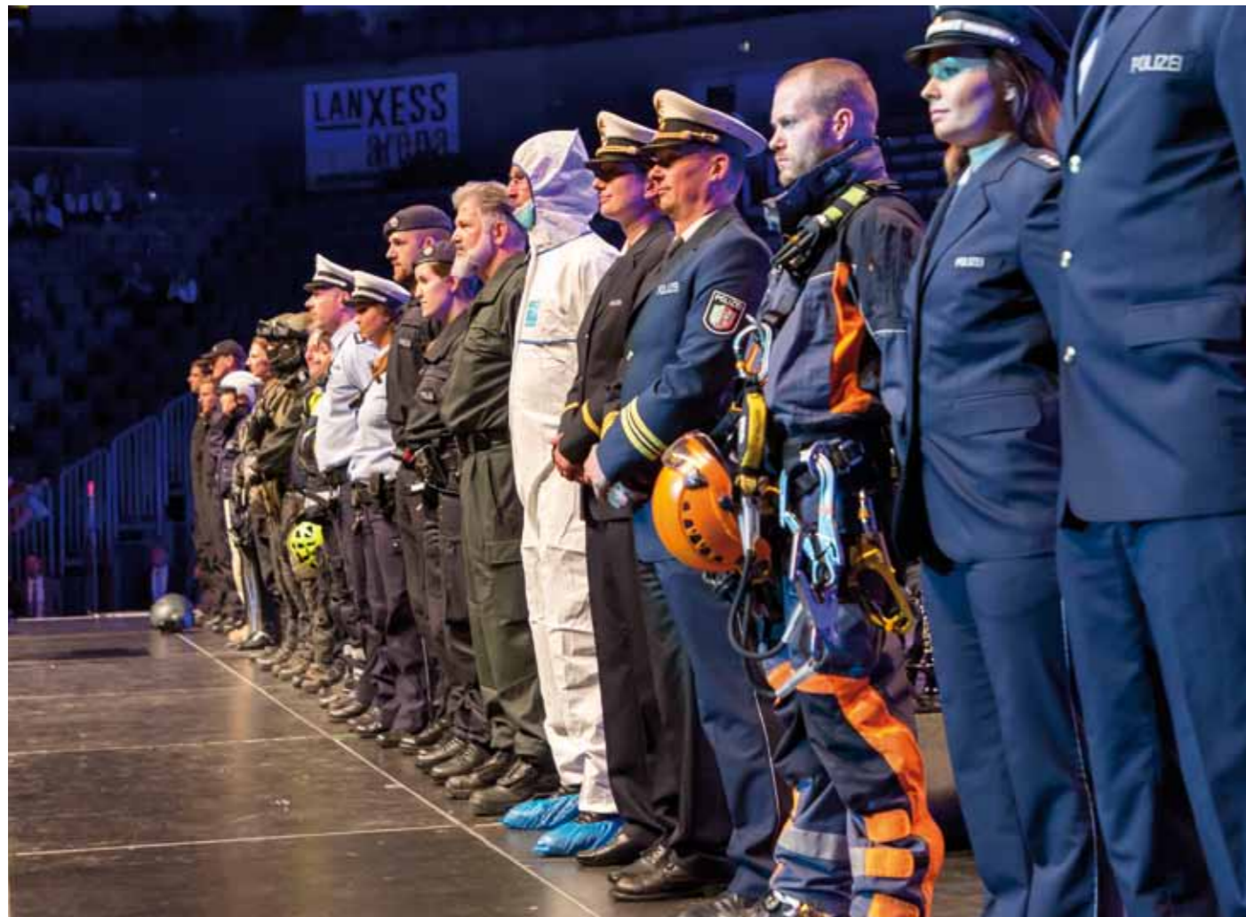
Die Vielfalt der Arbeit bei der Polizei zeigt sich auch in den zahlreichen Uniformen.

Reul schickt die Kommissaranwärterinnen und -anwärter mit einem großen Vertrauensvorschuss in die nächste Phase ihrer Ausbildung: »Ich vertraue Ihnen. Ich glaube, Sie machen alle einen super guten Job,« so Reul. Angesichts der vielfältigen Aufgaben bei der Polizei in NRW schließt er noch eine Bitte an: »Versprechen Sie mir alle, dass Sie die Prüfung bestehen. Denn wir brauchen alle. Wir können auf keinen verzichten.«