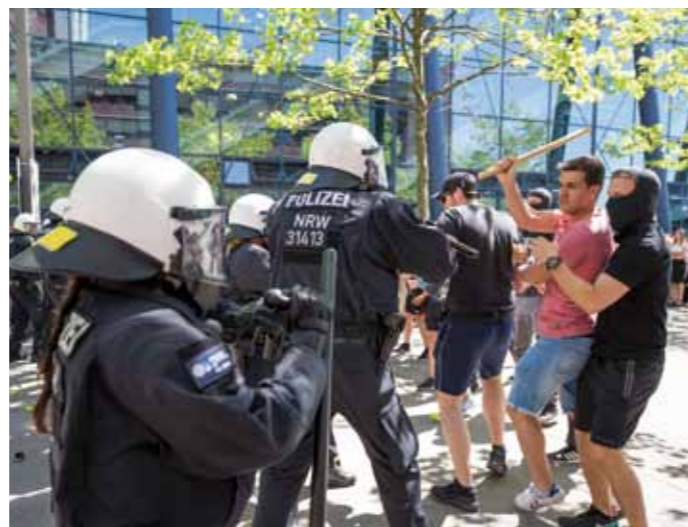
Bei der Leistungsschau konnten sich die Anwesenden vom Können der Polizei NRW überzeugen.