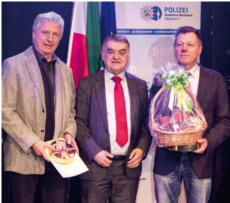
Polizeisportverein des Jahres 2017 aus NRW ist der PSV Dortmund 1922 e. V. Herzlichen Glückwunsch an alle Preisträgerinnen und Preisträger!