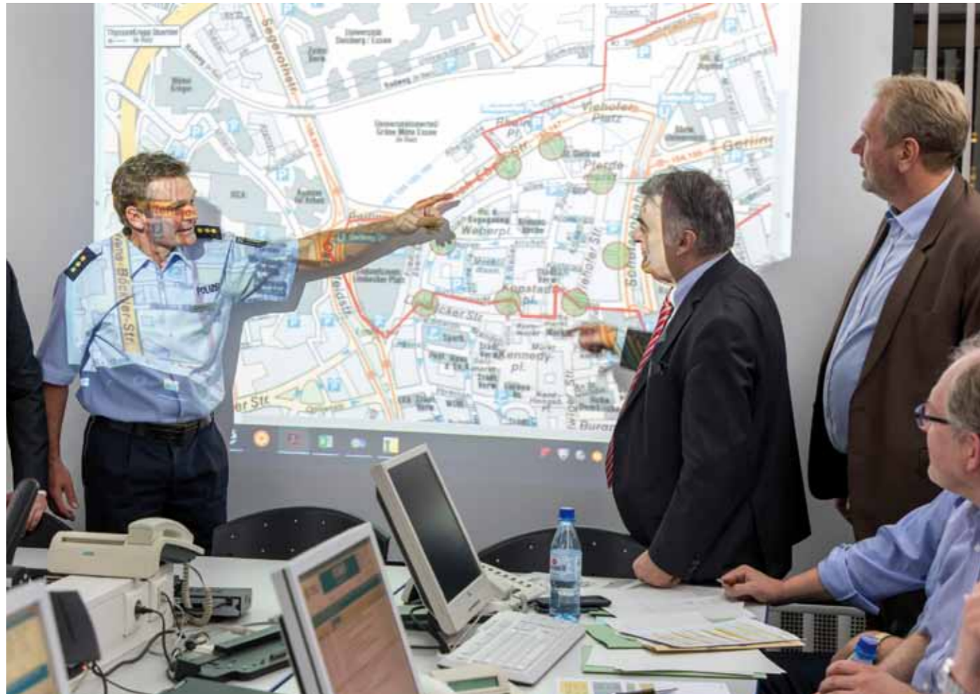
NRW-Innenminister Herbert Reul verschafft sich einen Eindruck von der Größe des Einsatzgebiets.