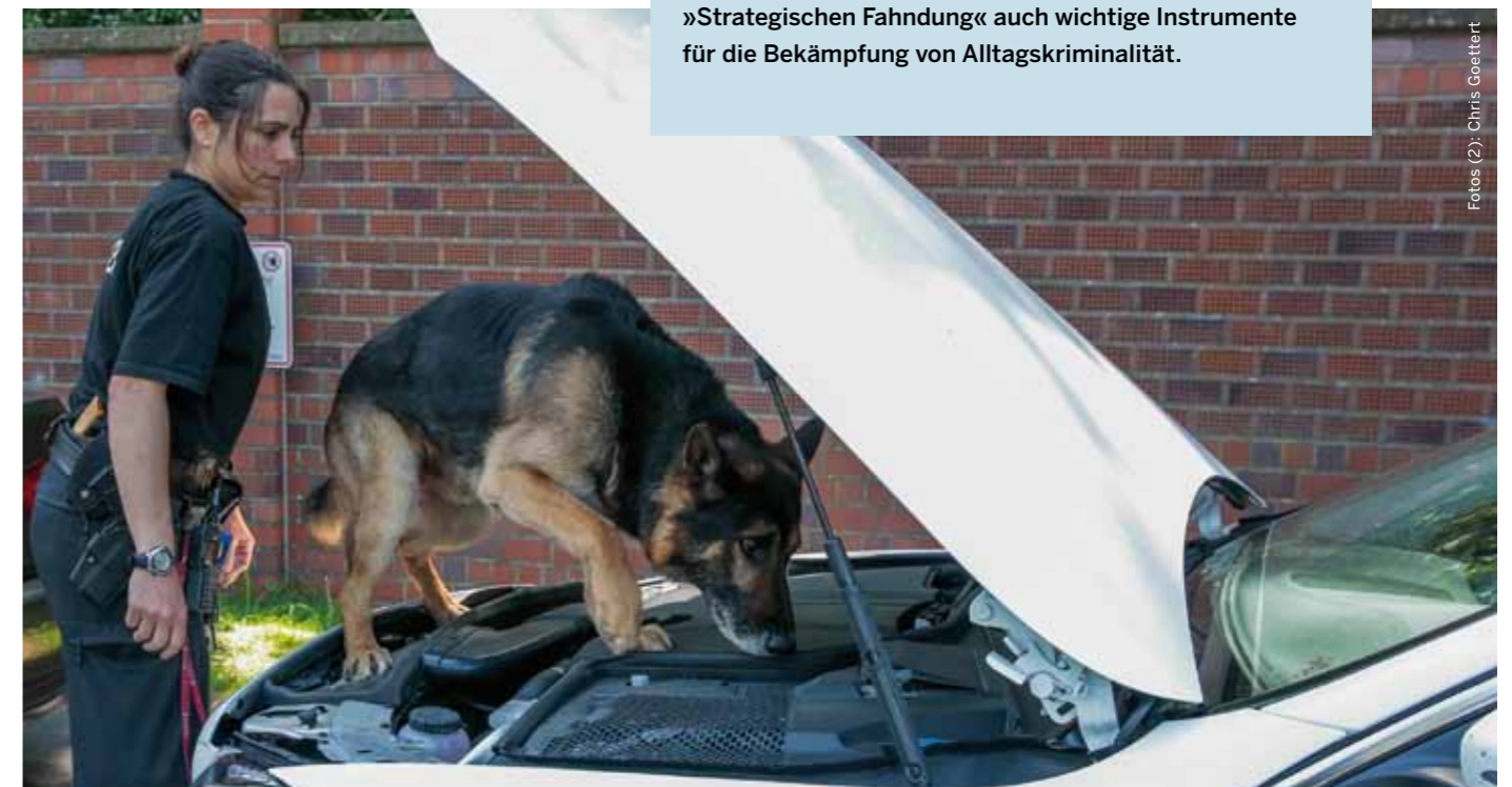
Bei den Kontrollen kommen auch Spürhunde zum Einsatz, die nach versteckten Drogen suchen.

Im Mittelpunkt des geplanten »Sicherheitspakets I« stehen Anti-Terror-Vorschriften wie etwa die Einführung der Telekommunikationsüberwachung, die Ausweitung des Unterbindungsgewahrsams und die Einführung der »elektronischen Fußfessel« für terroristische Gefährder. Darüber hinaus enthält das Paket mit der Ausweitung der Videobeobachtung und der Einführung der »Strategischen Fahndung« auch wichtige Instrumente für die Bekämpfung von Alltagskriminalität.