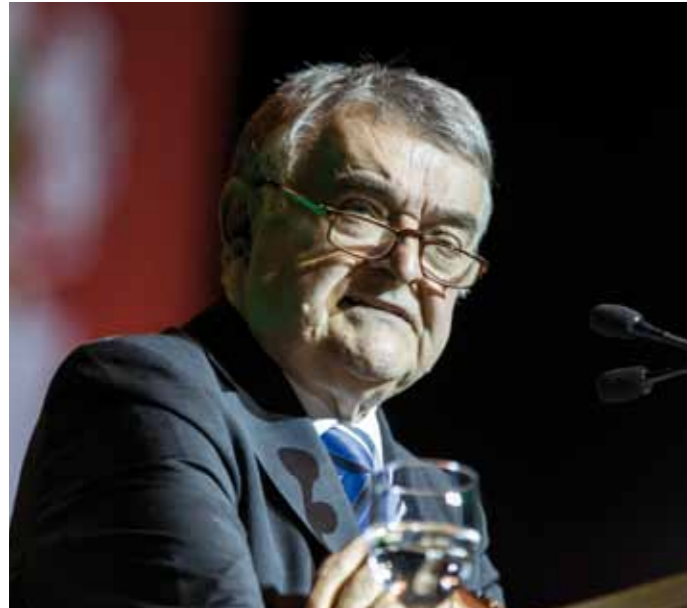
NRW-Innenminister Herbert Reul setzt auf die Empathie und den Teamgeist der Anwärterinnen und Anwärter.

Aus seiner Position als Dienstherr gibt Reul den angehenden Polizistinnen und Polizisten einige Empfehlungen mit auf den Weg: »Treten Sie überzeugt und selbstbewusst auf. Nicht arrogant und besserwisserisch. Zeigen Sie Empathie für die Menschen, die Ihre Hilfe brauchen. Passen Sie aufeinander auf. Unterstützen Sie sich gegenseitig. Und wenn es schwierig wird, seien Sie vorsichtig.«