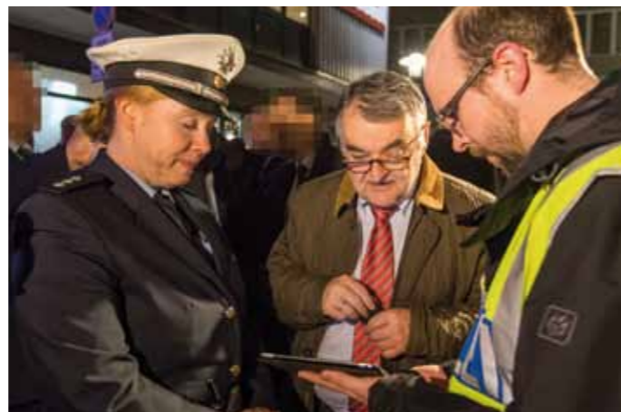
Die Zusammenarbeit der verschiedenen Behörden funktioniert in dieser Nacht vorbildlich.

Die zweite Welle erstreckt sich vom Ende des zweiten Weltkriegs bis ins Jahr 1960. Armut und die fortwährende türkische Politik der kulturellen Unterdrückung in der damals bettelarmen Region waren die Hauptursachen für die Auswanderung. Wegen des Bürgerkriegs im Libanon flüchteten viele Familien in den 1970er bis 90er Jahren nach Deutschland. Allein in Essen leben 5.000 Mhallamiye-Kurden, die sich auf nur zwölf Familien verteilen. Von diesen leben viele von Sozialhilfe, einzelne handeln aber auch mit Heroin oder Crack. Neben dem Rauschgifthandel werden diesen auch Erpressung, Diebstahl, Raub und Geldwäsche zur Last gelegt.