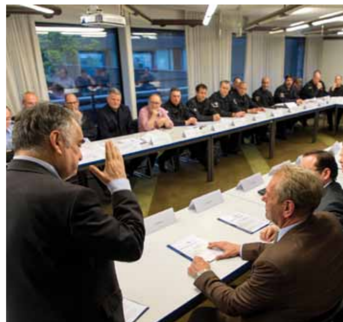
Die Bilanz der Razzia kann sich sehen lassen: U.a. gibt es acht Festnahmen und 20 Strafanzeigen.