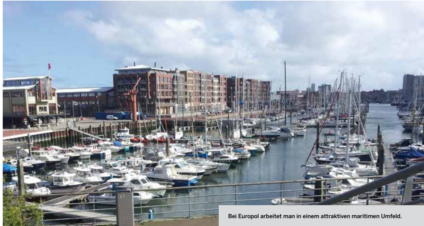
Bei Europol arbeitet man in einem attraktiven maritimen Umfeld.