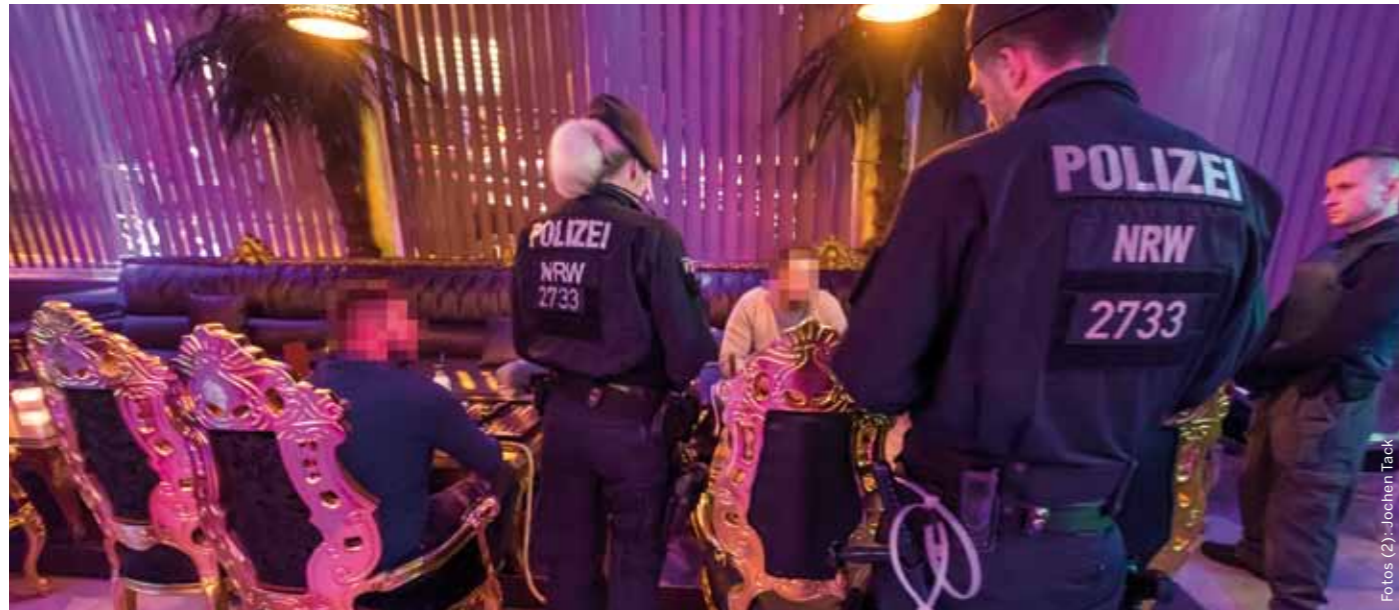
Die beliebten Shisha-Bars in der nördlichen Essener Innenstadt werden bei dieser Razzia ebenfalls durchsucht.