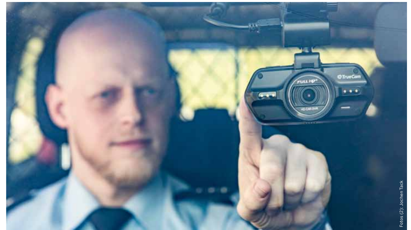
Während der einjährigen Testphase stehen der NRW-Autobahnpolizei insgesamt 50 Dashcams zur Verfügung.

Die aufgezeichneten Daten werden im Anschluss zum Fertigen einer Anzeige genutzt. Nach der Sachbearbeitung durch die Polizei wird die Anzeige zunächst an die zuständige Bußgeldstelle weitergeleitet, die einen Bußgeldbescheid erstellt. Wird dieser rechtswirksam, wird also kein Widerspruch eingelegt, wird das Videomaterial im Anschluss gelöscht. Kommt es zu einem Einspruch und anschließendem Gerichtsverfahren, wird das Video dort als Beweismittel eingebracht und nach einem rechtskräftigen Urteil ebenfalls gelöscht. »Indem nur anlassbezogen aufgenommen wird, wird das Prinzip der Datensparsamkeit gewahrt. Damit hält sich die Polizei an das geltende Recht nach dem Landesdatenschutzgesetz«, betont Wollgramm. >