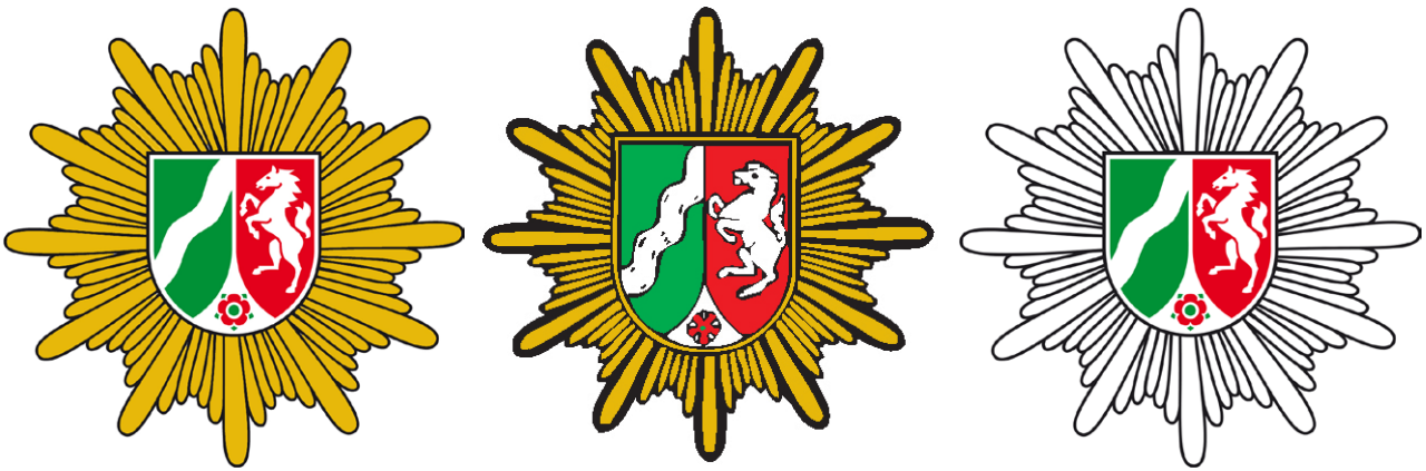
Das Behördenlogo des PP Bochum im Laufe der Zeit – vom reinen Polizeistern für alle Behörden über die Individualisierung mit den Stadtwappen bis hin zu einer einheitlichen Individualisierung für alle Behörden im Land im Jahr 2011.